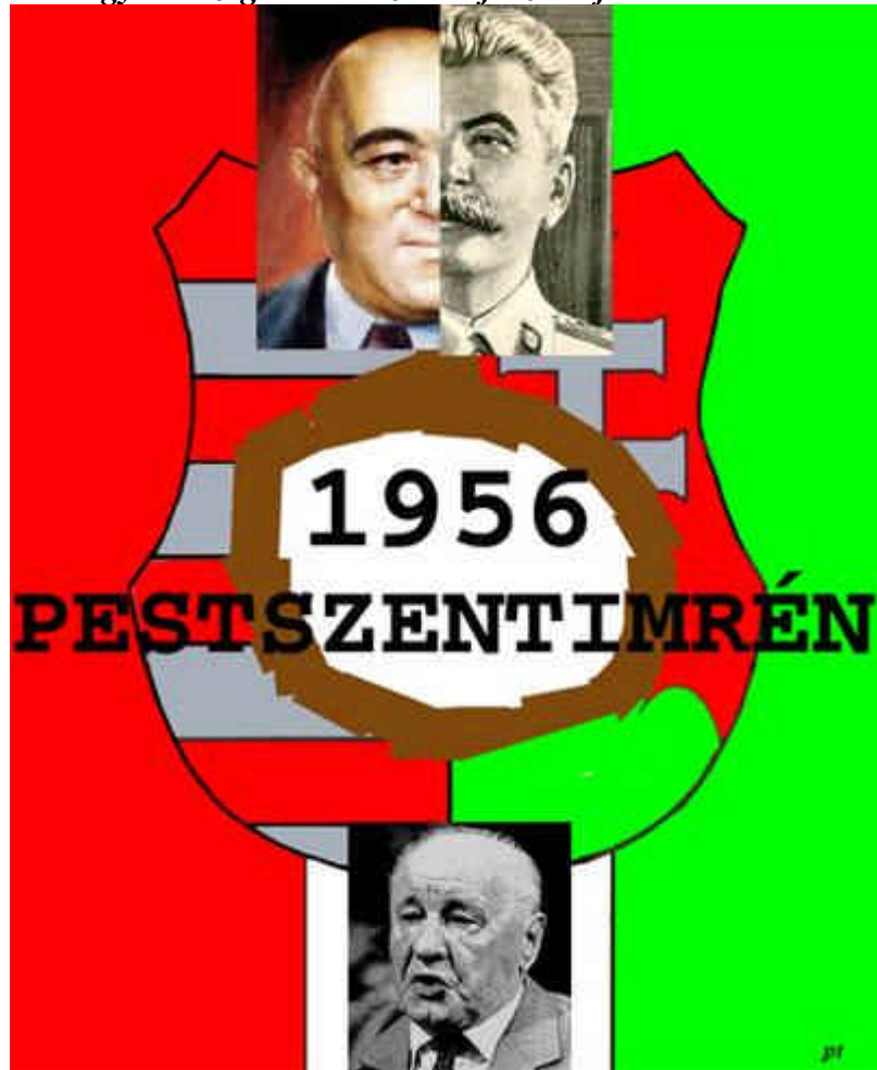
1956-os kiállítás plakátja